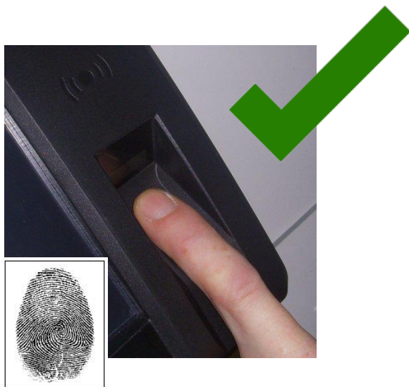
Správné přikládání prstu