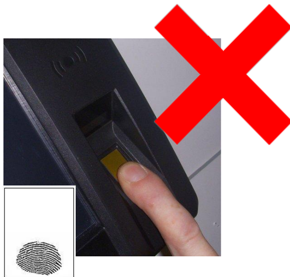
Špatné přikládání – malá plocha prstu na snímači